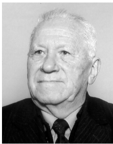
Роден е на Петров ден (1864 г.). Баща му, свещеник Константин Дъновски от село Хадърча

(дн. Николаевка, Варненско) възприема съвпадението на раждането с името на Апостола като знак Божи. Синът в зряла възраст става известен с духовното си име Бейнса Дуно. Учениците и последователите му го наричат УЧИТЕЛЯ. В семейството и в училището в гр. Варна е възпитаван в духа на възрожденските традиции. Любознателността му го отвежда в новооткритото в Свищов Арменско методистко училище. Тук се оформя трайния му интерес към различните доктрини за религиите.